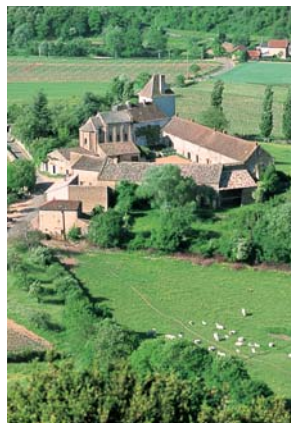
Berzé-la-Ville, la chapelle des Moines.

étroit, entre les buis et suivre à gauche au poteau directionnel. 1 À quelques dizaines de mètres, ( autre poteau directionnel ), prendre à gauche vers la montagne de la Fâ ( à droite liaison La Roche-Vineuse par circuit de Verzé ) et poursuivre cette sente dans la lande ( panoramas grandioses sur le Val, vue à gauche sur la roche Coche ). 2 À 1,2 km environ, nouveau carrefour de sentiers ( poteau directionnel ), descendre à gauche ( tout droit, liaison Verzé ), entre buis et noisetiers et à droite à la petite route. 3 Après l'épingle à cheveux, monter à gauche vers la roche Coche et la table d'orientation (ne pas suivre accès direct) : panorama . Là, plusieurs chemins, bien prendre celui qui part plein nord (parallèle à celui d'arrivée). Aux croisements : à droite (sentier entre des buis denses), puis à gauche et 2 e à droite. 4 À la prairie entourée de landes, bien suivre la clôture sur la gauche pour la traverser, poursuivre le sentier entre les buis et les chênes et rejoindre le village. 5 Tourner à droite et