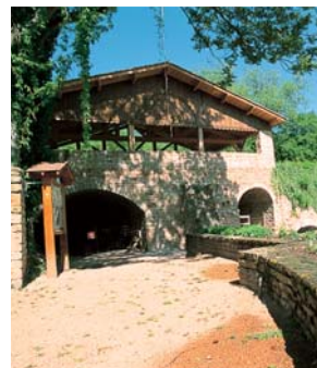
Les fours à gypse.