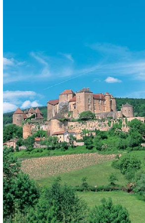
Dominant le Val Lamartinien, la forteresse de Berzé délivre toujours son message.

Dès les premiers kilomètres, la route escarpée caracolée à 475 m ; le regard se noie dans la vallée de la Saône et, par temps clair, pousse l'horizon jusqu'aux Alpes. Sur la montagne de Chaux, à 539 m, la vue embrasse les roches de Solutré et Vergisson, les coteaux couverts de vigne et les monts du Clunyois habillés de forêts.