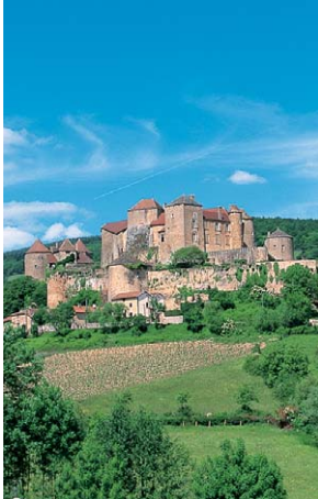
Dominant le Val Lamartinien, la forteresse de Berzé délivre toujours son message.

Dès les premiers kilomètres, la route escarpée caracolée à 475 m ; le regard se noie dans la vallée de la Saône et, par temps clair, pousse l'horizon jusqu'aux Alpes. Sur la montagne de Chaux, à 539 m, la vue embrasse les roches de Solutré et Vergisson, les coteaux couverts de vigne et les monts du Clunyois habillés de forêts.