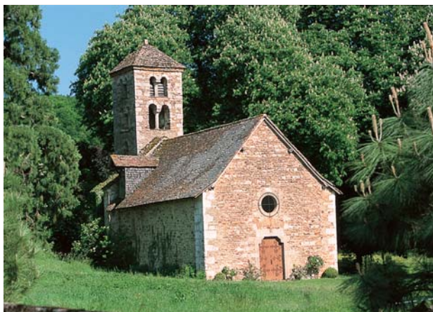
La chapelle de Nancelle, édifiée à partir de la pierre non gélive des carrières de La Lie.

D Devant la mairie (parking). Rejoindre l'église et prendre direction Hurigny. À 500 m prendre à gauche le chemin des Petits Monts. 1 Dans le hameau, tourner à gauche (rue du Mont-Rouge) et poursuivre dans la même direction au-delà du 2 e château d'eau. 2 Au carrefour des chemins, rejoindre à gauche le hameau du Gros-Mont. Descendre jusqu'à la route. 3 Prendre à gauche, puis la première à droite jusqu'à La Grande-Burette. Avant la 1 re maison du hameau, tourner à droite par un chemin étroit en sous-bois et tourner à droite au chemin forestier. 4 Avant de traverser une clairière bifurquer à gauche dans un sentier étroit qui tourne tout de suite à droite avant de descendre à gauche et rejoindre un chemin plus large menant à Nancelle (jolie chapelle romane - panorama). Prendre à droite puis le premier chemin à gauche (attention, peu visible). Poursuivre le chemin gravillonné à gauche. 5 Traverser la route, rejoindre une autre petite route et prendre juste en face. En haut, tourner à droite et au carrefour forestier prendre encore à droite. 6 Au croisement (potéau directionnel), tourner à gauche (tout droit, liaison La Roche-Vineuse, circuit 10) et tout de