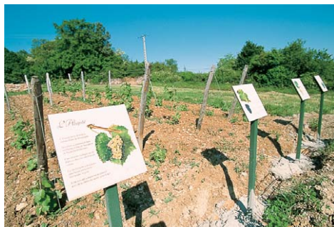
La colline de Monceau.

le pavée. En haut monter la rue à droite. 2 Prendre à droite au monument aux morts, et le passage à gauche juste avant le lavoir. Tourner à droite devant l'école et emprunter un peu après à gauche un sentier montant fortement. Continuer à monter à droite de l'église. 3 Au carrefour (poteau directionnel), prendre à gauche le chemin de La Rochette (vers les carrières de La Lie). Monter par la petite route, entrer en forêt communale de La Roche-Vineuse, et redescendre vers la droite par un chemin de terre. 4 Au carrefour des chemins, tourner à droite, encore à droite au hameau de La Tanière et à gauche au carrefour en T. Prendre à droite vers les carrières de La Lie. 5 Au croisement (poteau directionnel), tourner à droite (tout droit circuit 9) et tout de suite à gauche pour entrer dans les carrières de La Lie. Poursuivre sur le parcours commenté, et descendre le chemin de