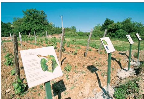
La colline de Monceau.

le pavée. En haut monter la rue à droite. 2 Prendre à droite au monument aux morts, et le passage à gauche juste avant le lavoir. Tourner à droite devant l'école et emprunter un peu après à gauche un sentier montant fortement. Continuer à monter à droite de l'église. 3 Au carrefour (poteau directionnel), prendre à gauche le chemin de La Rochette (vers les carrières de La Lie). Monter par la petite route, entrer en forêt communale de La Roche-Vineuse, et redescendre vers la droite par un chemin de terre. 4 Au carrefour des chemins, tourner à droite, encore à droite au hameau de La Tanière et à gauche au carrefour en T. Prendre à droite vers les carrières de La Lie. 5 Au croisement (poteau directionnel), tourner à droite (tout droit circuit 9) et tout de suite à gauche pour entrer dans les carrières de La Lie. Poursuivre sur le parcours commenté, et descendre le chemin de