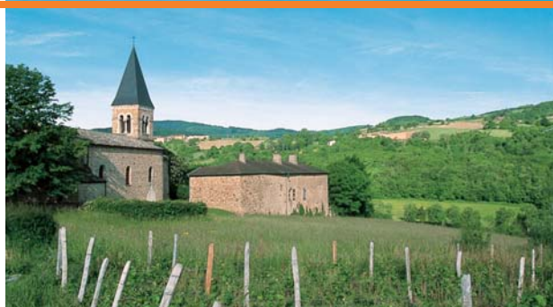
L'église de Serrières.

D Place de l'église, devant la mairie (parking). Descendre le chemin sur la gauche (sens interdit). 1 Traverser la route, passer le ruisseau, prendre à droite, monter à gauche, choisir systématiquement le chemin montant le plus. Passer la maison et prendre la route à gauche. 2 Traverser la route, prendre en face et le 1 er chemin à droite. ( hameau des Monterrains, maisons anciennes de caractère ). Tourner à gauche à la route et encore à gauche vers Les Gravats. 3 Au carrefour des chemins, descendre à gauche, et après la maison prendre la route à droite et la suivre jusqu'au bout en