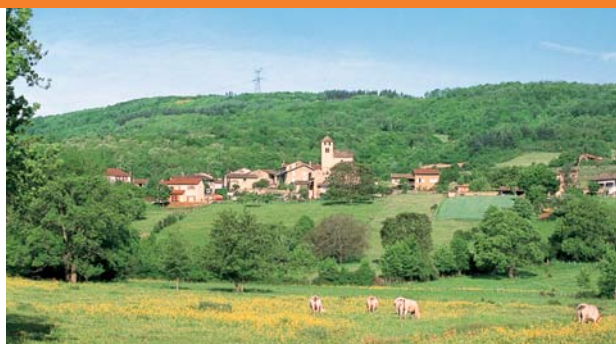
Le très ancien village de Sologny, dont les toits de tuiles romaines annoncent le Midi, fait corps autour de son église romane à la curieuse tour-clocher. Quelques typiques maisons à galerie mâconnaise et les lavoirs en complètent le charme.

D Devant la mairie, parking. 1 Prendre la petite rue en face vers le couvent et le chemin à gauche après la dernière mai-